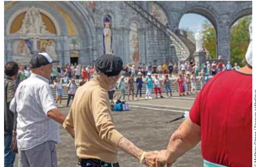
Des personnes en précarité et des bénévoles participent au festival organisé en août 2023 à Lourdes.

L'espérance chrétienne embrasse la certitude que notre prière parvient à Dieu.