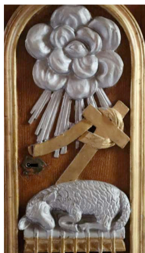
→ Ravenoville : la porte du tabernacle.

Cette représentation est fréquente dans les églises de l'Est