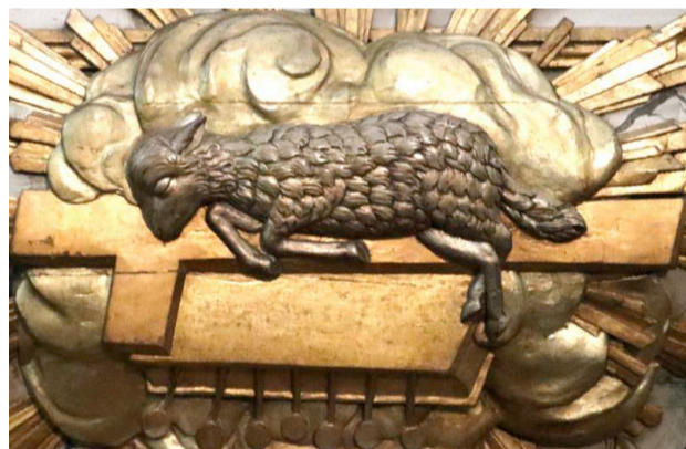
→ Carentan : sur le maître-autel de l'église Notre-Dame, l'Agneau immolé gisant sur la croix et le livre aux sept sceaux.