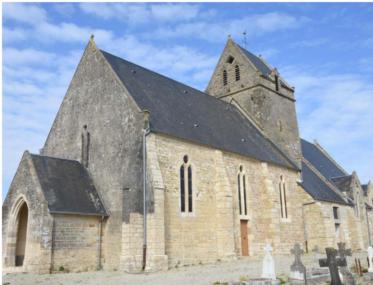
L'église restaurée de Méautis. Odile DELAUNAY

DU 5 AU 16 JUIN 2024 , de 10 h à 19 h, à la salle de convivialité, la commune de Méautis va présenter une exposition intéressante : « La vie des habitants de Méautis de 1939 jusqu'à la Reconstruction ». L'entrée est gratuite. Cette manifestation est labellisée.