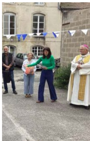
En présence de Mgr Cador. DR

Pour les plus jeunes : «52 soirées sans écran» d'Adeline Voizard aux éditions Mame. 52 idées de soirées adaptées à tous les âges pour passer plus de temps tous ensemble et échanger. DR