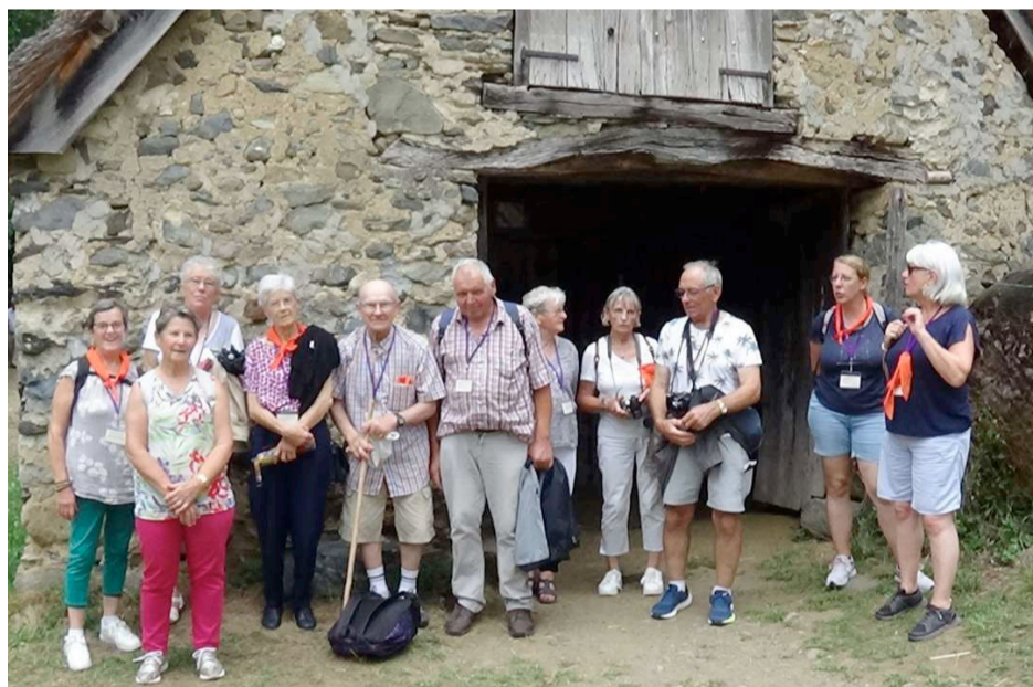
→ Des pèlerins du doyenné de Valognes à la bergerie de Bartès le 25 août.