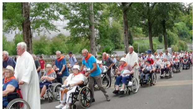
→ Procession eucharistique vers la basilique souterraine le 24 août.

Leur reportage se retrouve sur le site du diocèse et sur celui du doyenné de Valognes.