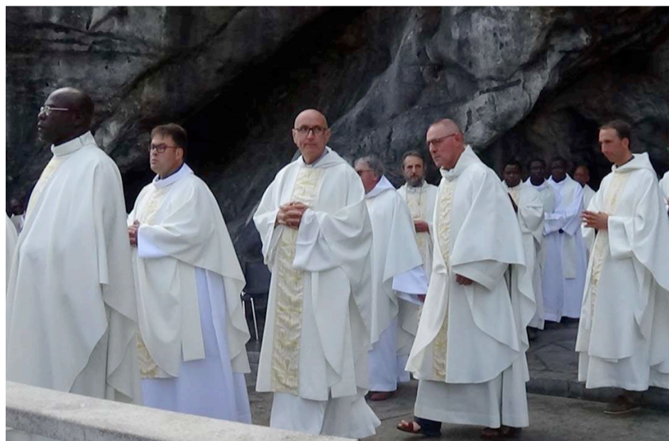
→ Les prêtres de la province de Normandie lors de la messe à la grotte.