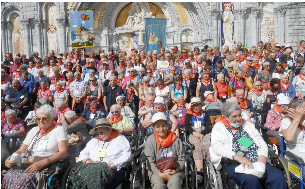
→ Les pèlerins de la Manche devant la basilique du Rosaire le 23 août.