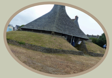
le baptistère de Portbail

Merci à tous les organisateurs et les participants pour cet agréable moment passé ensemble.