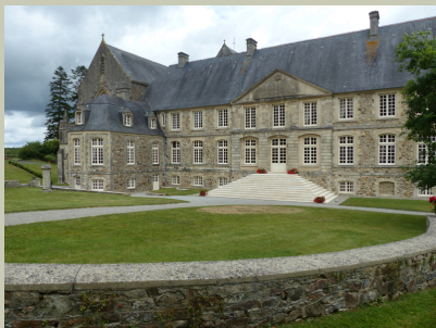
l'Abbaye et le tombeau de Soeur Marie-Madeleine