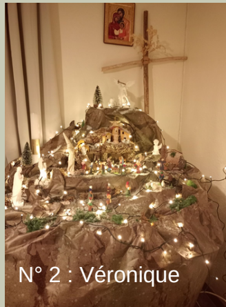
N° 2 : Véronique