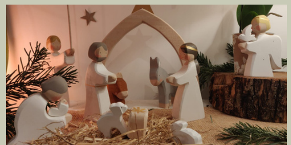
N° 3 : Benoît et Emmanuelle