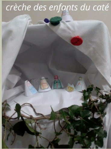
crèche des enfants du caté