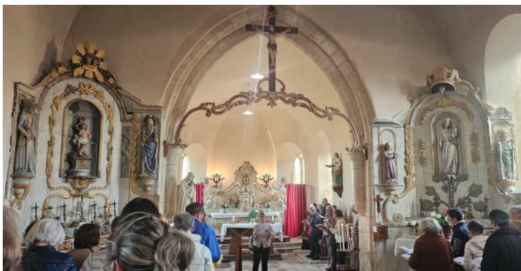
Messe à Sénoville le jeudi 10 octobre 2024