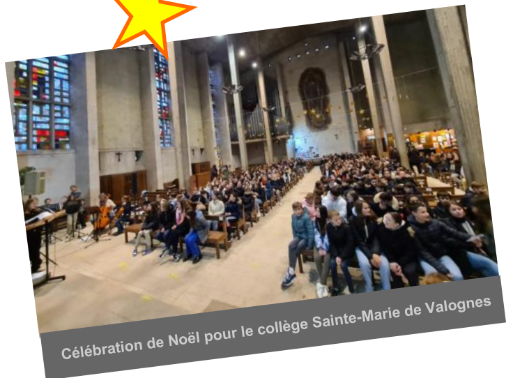
Célébration de Noël pour le collège Sainte-Marie de Valognes