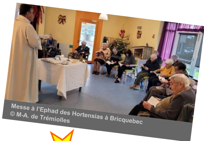
Messe à l'Ephad des Hortensias à Bricquebec