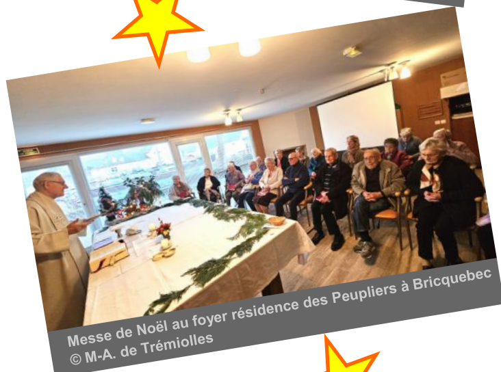
Messe de Noël au foyer résidence des Peupliers à Bricquebec