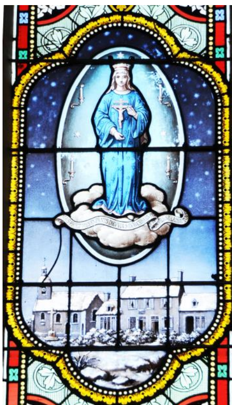
Vitrail de l'église de l'Etang-Bertrand, Notre Dame de Pontmain

Depuis septembre dernier, notre secteur pastoral s'est élargi. Nous apprenons à nous connaître et à nous estimer mutuellement. Nous progressons à travailler ensemble, non comme une menace mais comme un atout pour l'annonce de l'Evangile chez nous et à tous. Bien loin de vouloir élaborer des plans pastoraux de rêve ou donner des orientations d'uniformisation irrespectueuses de chaque histoire paroissiale, nous choisissons plutôt et humblement de travailler dans la durée à l'harmonie de nos cinq paroisses. Afin de nous connaître davantage et mieux, dans la simplicité toujours, l'idée a émergé de vivre quelque chose de fraternel et surtout