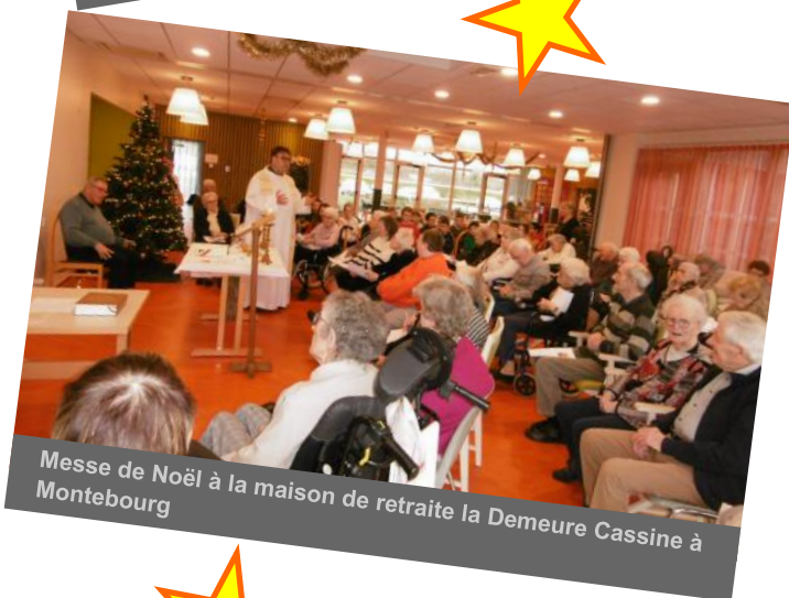
Messe de Noël à la maison de retraite la Demeure Cassine à Montebourg