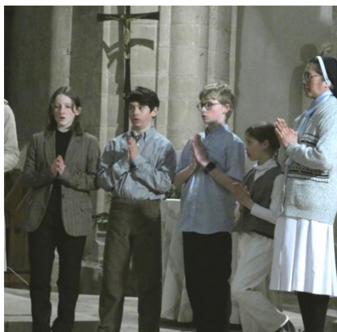
Un des tableaux du spectacle des jeunes lors de la Mission à St-Sauveur-le-Vicomte, en mars 2023