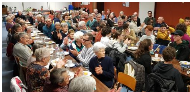
Les convives du repas partage de Valognes le 21 mars