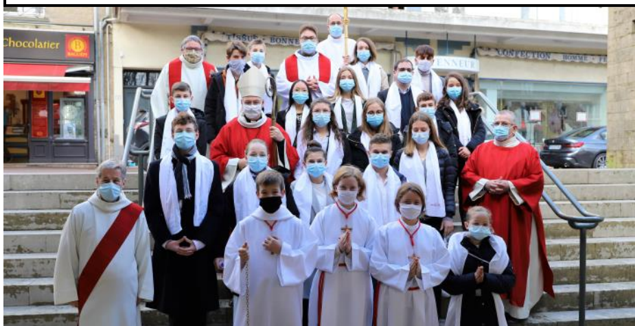
Groupe des confirmés du 17 janvier à Valognes