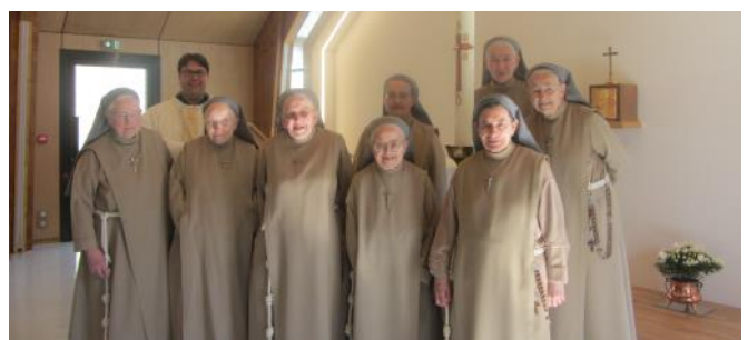
Pâques 2020 dans la chapelle Ste-Thérèse