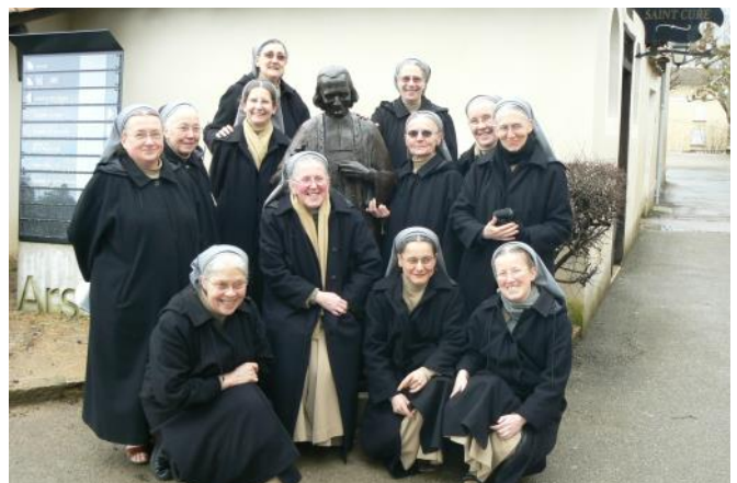
Pèlerinage à Ars en 2010