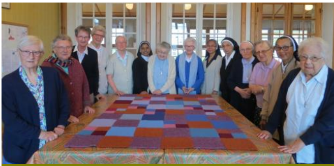
Couverture réalisée lors des travaux manuels.