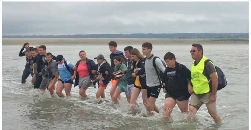
Journée cohésion de l'établissement en septembre 2019

Frères des Ecoles Chrétiennes Collège et lycée Abbaye, route de Quinéville 50310 MONTEBOURG