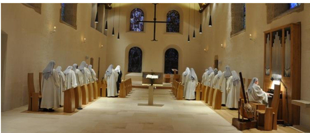
Sœurs Bénédictines en prière