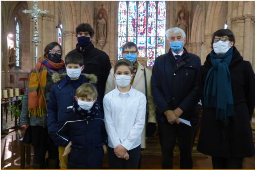
Une famille le jour de la première communion de leur enfant