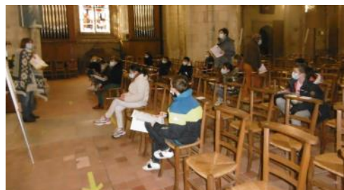
Eglise de Montebourg