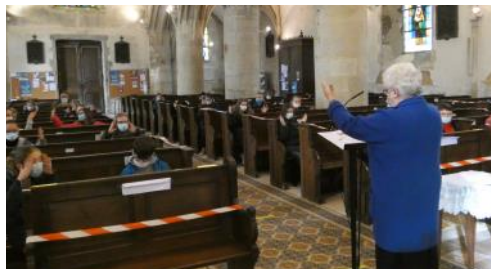
Eglise de Saint-Sauveur-le-Vicomte