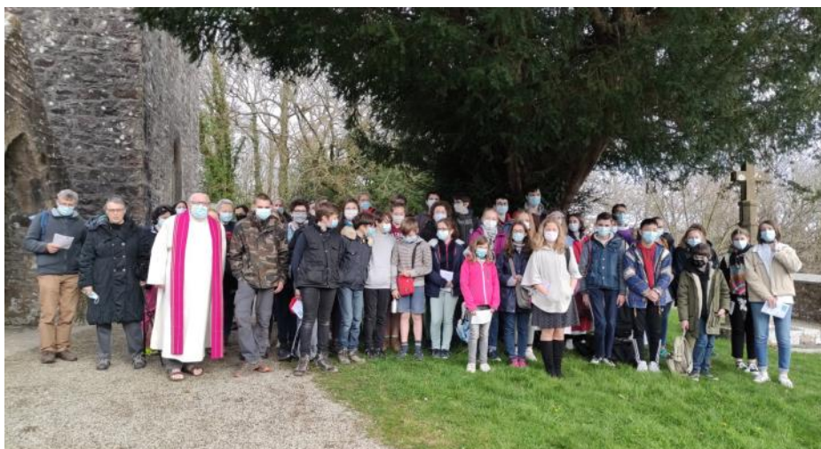
Marche pascale des jeunes du doyenné, le 20 mars 2021, du Mont de Besneville à l'église de Taillepied.