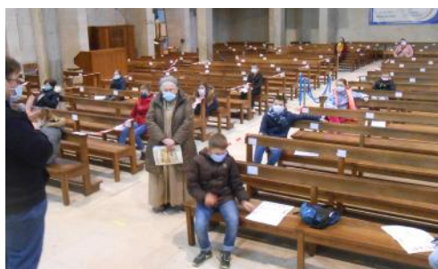
Eglise de Valognes