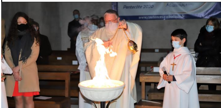
Le 4 avril, au petit matin, la vigile pascale à Valognes