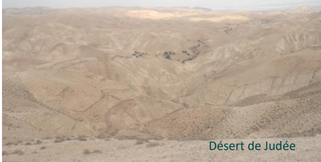
Désert de Judée

En ce temps-là, Jésus fut conduit au désert par l'Esprit (Matthieu 4,1)