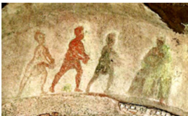
Adoration des Mages, III e siècle, Rome, catacombe de Priscilla, chapelle grecque