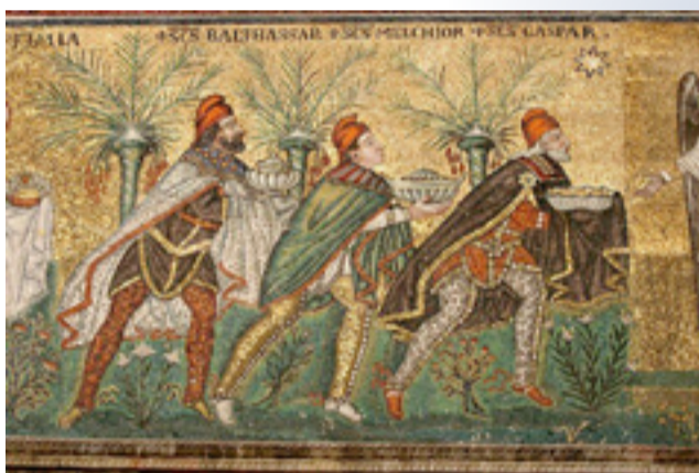
V e siècle - Mosaïque basilique Saint-Apollinaire-le-neuf, Ravenne Les trois personnages, coiffés de bonnets phrygiens, sont signes de l'étranger venu de l'est. Et l'iconographie s'est multipliée ensuite avec toujours le même message : l'Évangile est pour tous.