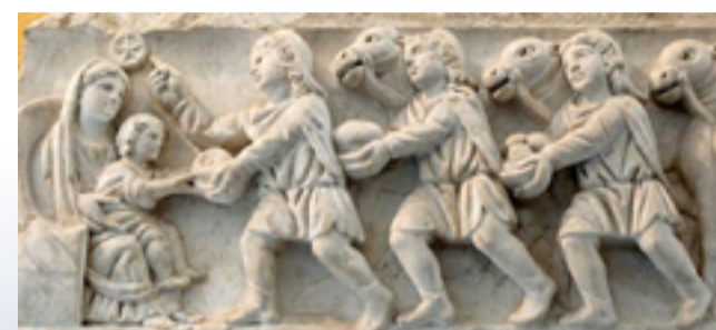
Adoration des Mages. Panneau d'un sarcophage romain. IV e siècle. Provenant du cimetière de Sainte Agnès à Rome. Musée du Vatican

Trois hommes fléchissent le genou devant un enfant tenu sur les genoux de sa mère. Au-dessus d'eux, le dessin d'une étoile impose la lecture de cet Évangile selon saint Matthieu, chapitre 2.