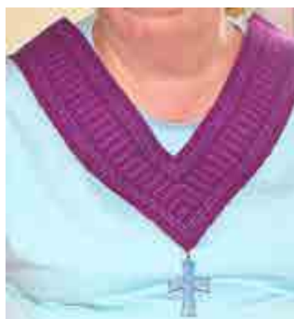
La célébration s'organise selon le rituel : l'officiant, revêtu de son scapulaire et l'accompagnant, accueillent le cercueil à l'entrée de l'église.

La troisième année, basée essentiellement sur la connaissance du rituel et l'approfondissement des textes bibliques, conduit l'évêque à donner une lettre de mission au nouvel officiant pour une durée de trois ans renouvelable. Il peut ainsi conduire au nom de l'Église la célébration des funérailles dans la paroisse, portant un scapulaire violet, signe de sa fonction.