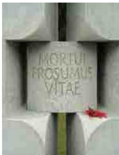
"Même dans la mort nous servons la vie": inscription en latin sur une fosse commune dédiée aux donneurs de corps.

L'établissement organise tous les ans une cérémonie en hommage aux donneurs sauf volonté contraire de ces derniers. Les proches peuvent participer à cette cérémonie. ■