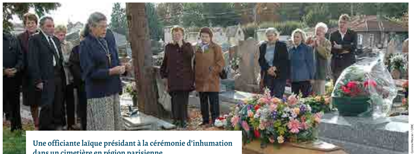
Une officiante laïque présidant à la cérémonie d'inhumation dans un cimetière en région parisienne.

Ainsi, certaines personnes susceptibles de remplir cette fonction seront appelées par leur curé qui les jugera aptes à faire face à des situations souvent difficiles devant la souffrance et le désarroi des familles. Le futur officiant laïc* devra montrer une grande