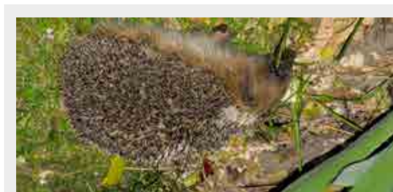
Il s'agit d'un bel hérisson dans mon jardin.