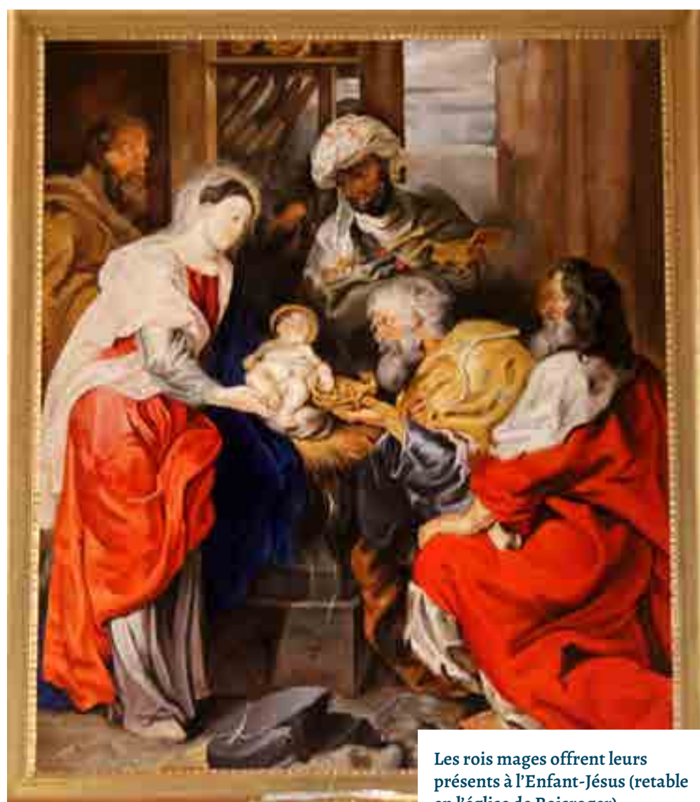
Les rois mages offrent leurs présents à l'Enfant-Jésus (retable en l'église de Boisroger)