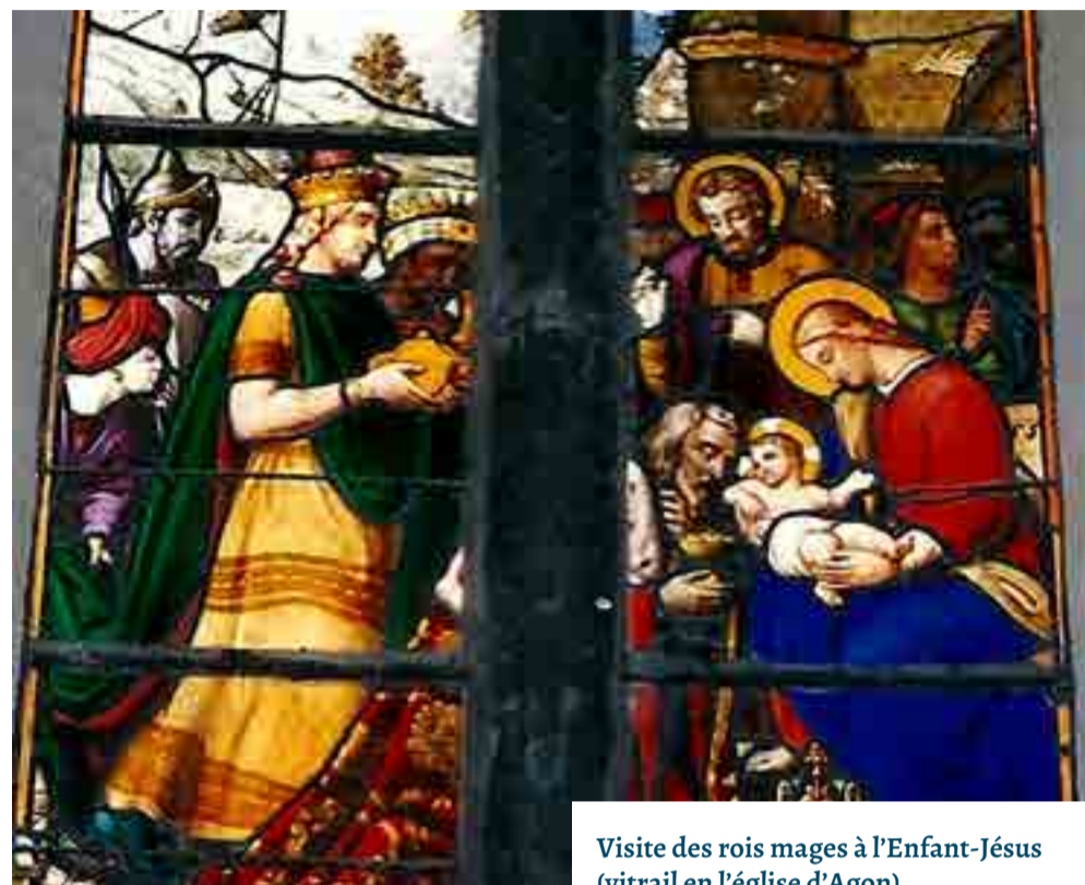
Visite des rois mages à l'Enfant-Jésus (vitrail en l'église d'Agon).

séquence. Pour reprendre saint Matthieu, ce dernier rappelle aux juifs devenus chrétiens que le nouveau-né de Bethléem est le Roi non seulement du peuple d'Israël, mais aussi des nations païennes, le Salut s'adressant donc à tous. Ils auraient offert trois cadeaux à l'Enfant Jésus né douze jours avant leur venue, de l'or, de l'encens et de la myrrhe. Au IV e siècle, saint Ambroise de Milan décrira ces présents comme une manière de souligner ce que représentait Jésus : à la fois Roi par l'or, Dieu par l'encens et Homme mortel par la myrrhe. Le jour de l'Épiphanie est le 6 janvier mais, depuis 1802, un décret du cardinal Caprara, légat du pape Pie VII la fixe le deuxième dimanche après Noël, soit le premier dimanche de janvier.