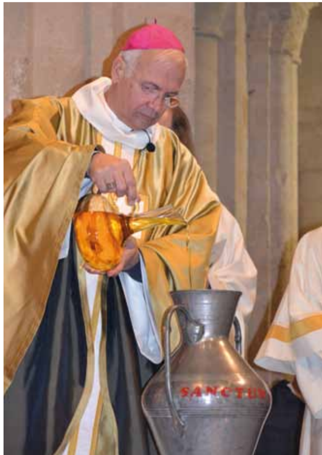
L'évêque verse les parfums.

À la fin de la célébration, chaque curé vient chercher ses saintes huiles. elles seront utilisées pour tous les sacrements de l'année.