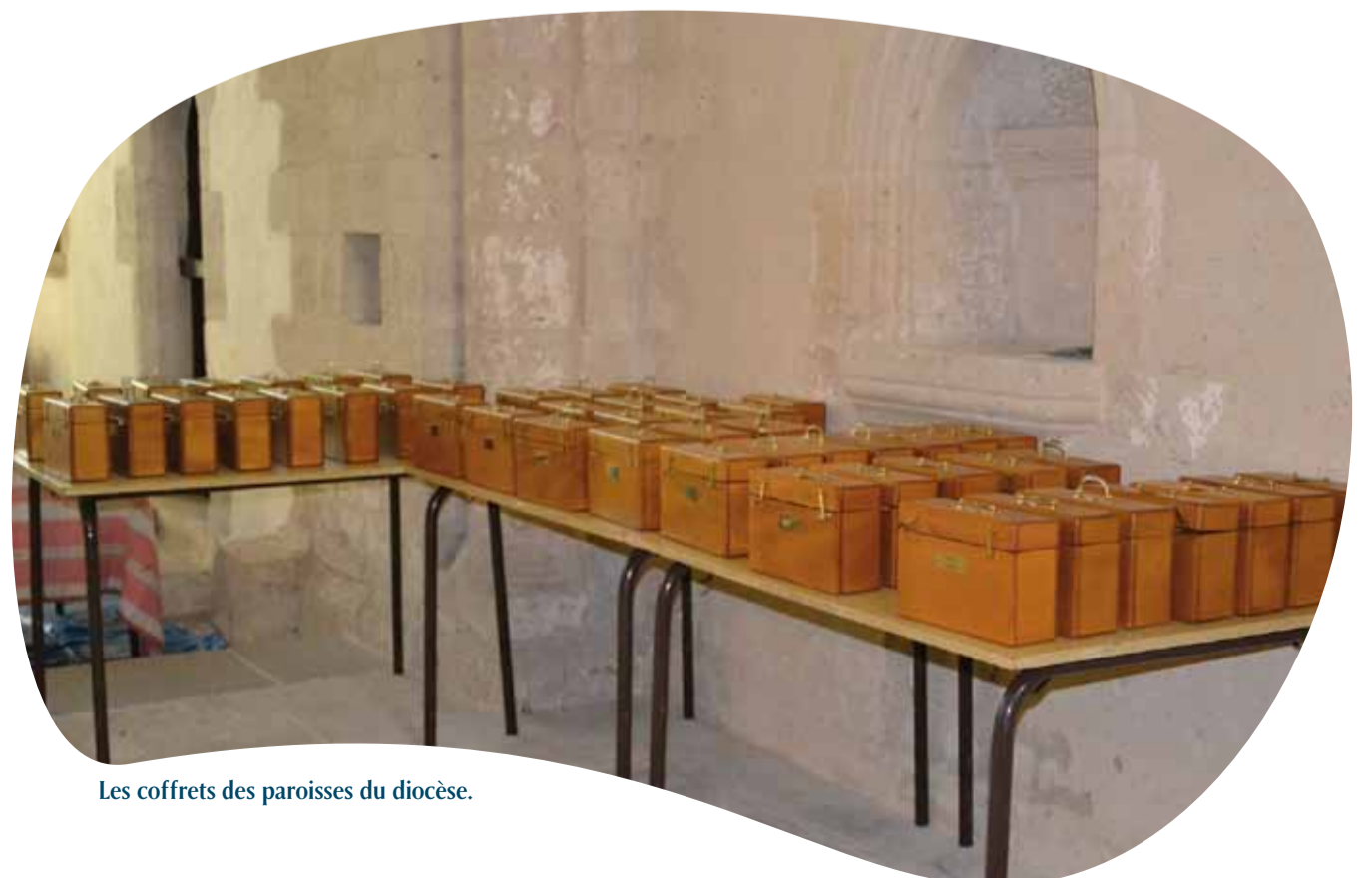
Les coffrets des paroisses du diocèse.

Les fidèles sont ensuite invités à prier pour eux et pour leur évêque afin que chacun puisse remplir les missions et les charges qui leur sont confiées.