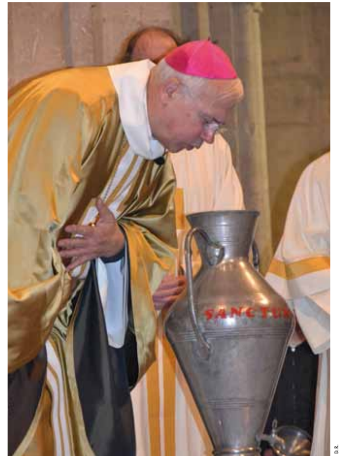
Le souffle de l'Esprit.

Dernière minute: Mgr Stanislas Lalanne avait choisi de célébrer la messe chrismale dans notre paroisse à l'église Notre-Dame-des-flots. Sa nomination comme évêque de Pontoise à compter du 31 janvier entraîne l'annulation de ce choix. La célébration aura lieu à la cathédrale de Coutances le lundi 25 mars à 18 h. ■