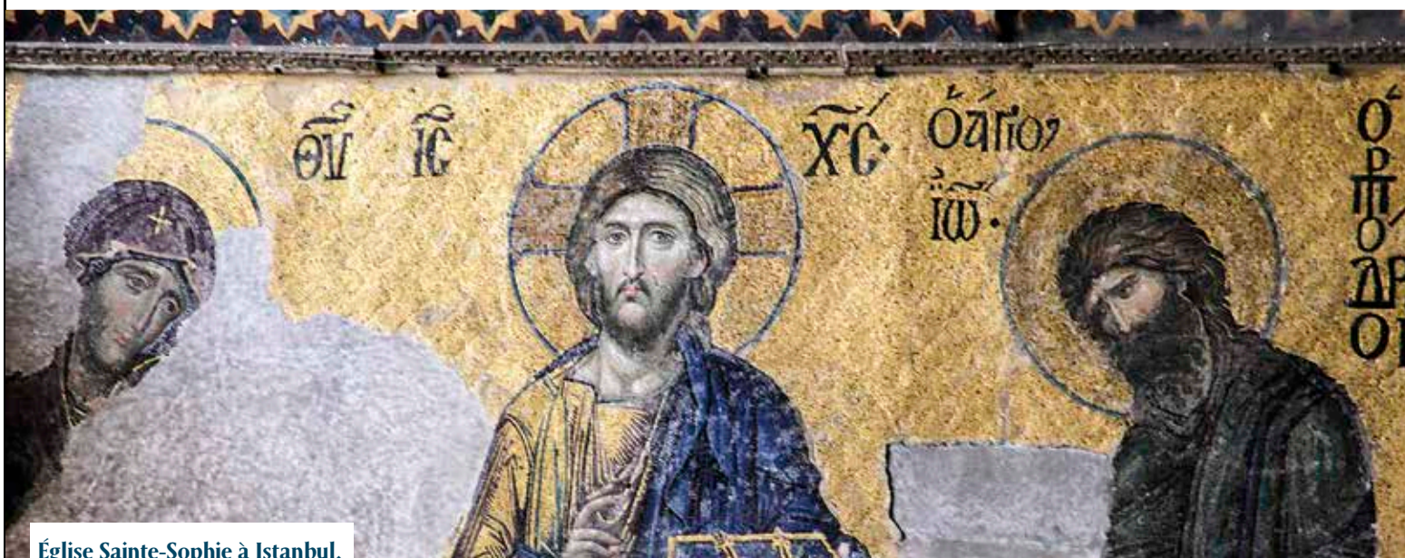
Église Sainte-Sophie à Istanbul.