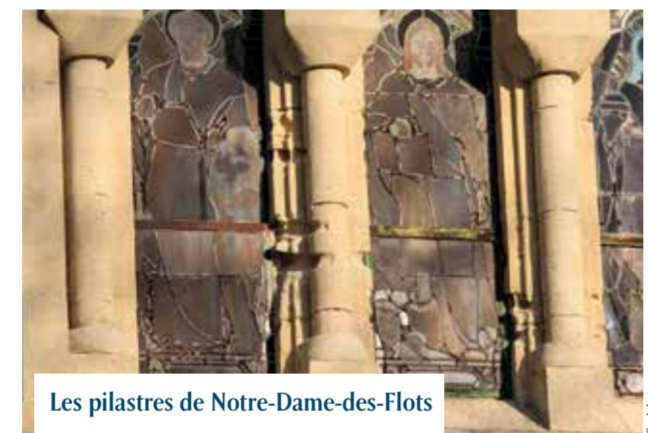
Les pilastres de Notre-Dame-des-Flots