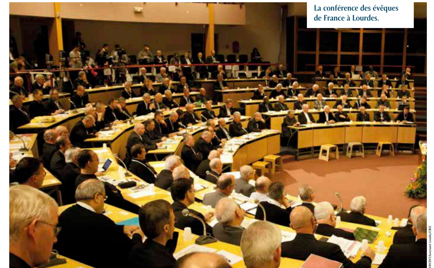
La conférence des évêques de France à Lourdes.

5. C'est d'autant plus difficile, développe le chapitre 5 que la nation n'est plus homogène, bousculée par la mondialisation et les revendications identitaires, communautaires, culturelles, religieuses. "Il devient dès lors plus difficile de définir clairement ce que c'est d'être français".