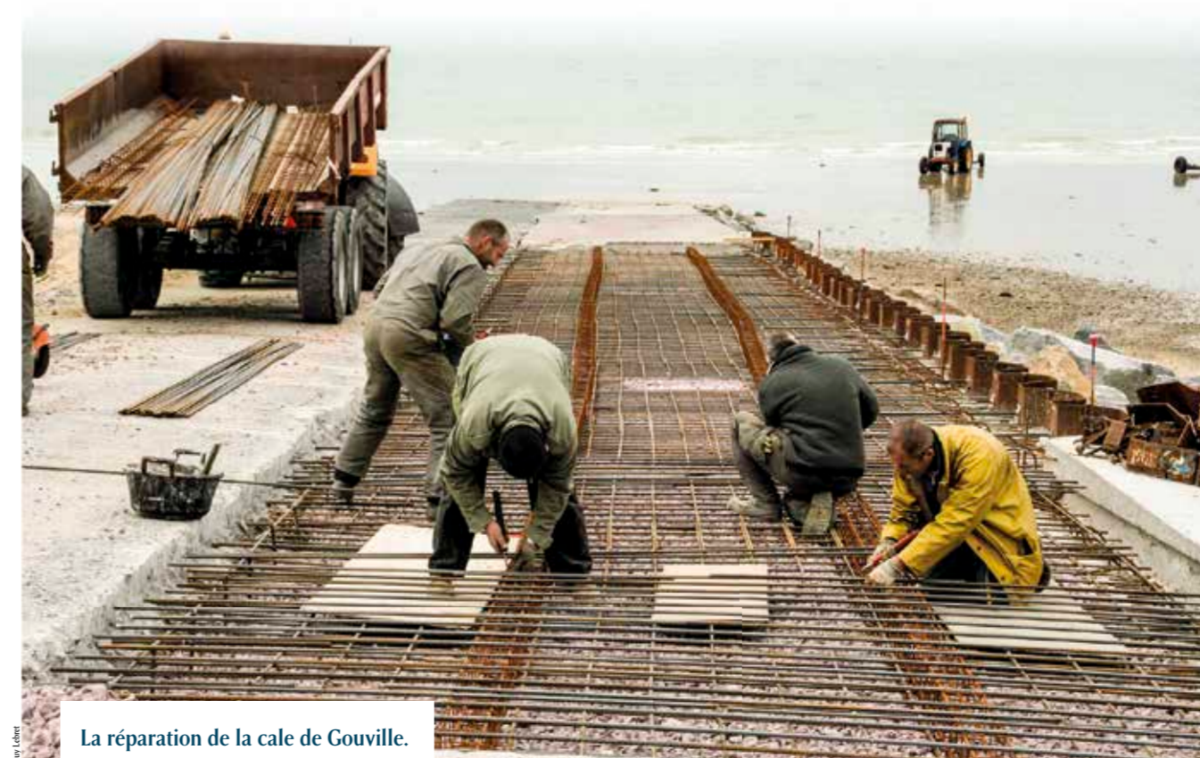
La réparation de la cale de Gouville.

Huit agents techniques assurent les travaux de la commune souvent avec des renforts embauchés en contrats aidés afin de répondre au choix de la municipalité qui leur confie en plus de l'entretien des bâtiments les travaux de nouvelles constructions et de nouveaux aménagements. En outre, la municipalité se démarque par un grand parc de propriété foncière dont treize gîtes et la Filature qui s'ajoutent aux bâtiments habituels d'une commune. Gou-