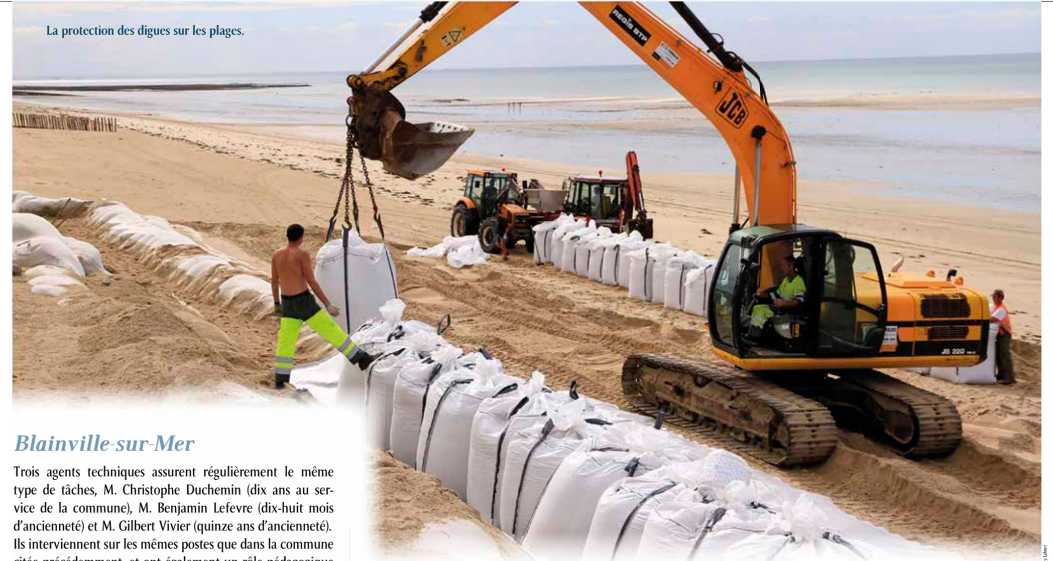
La protection des digues sur les plages.