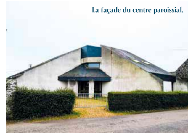
La façade du centre paroissial.

“La Fraternelle”, association liée étroitement à la paroisse, est propriétaire du centre paroissial et du presbytère d'Agon. La paroisse a aussi en charge l'église Notre-Dame-des-Flots à Coutainville, construite après 1905 (date de la séparation de l'Église et de l'État).