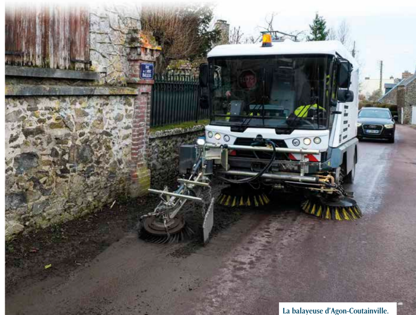
La balayeuse d'Agon-Coutainville.

Leur souci actuel est de protéger l'environnement, en tentant d'utiliser a-minima les produits phytosanitaires bien que la loi autorise encore ces produits dans les cimetières et les terrains de sport sur décret du maire. Leurs tâches sont plus nombreuses pendant la saison estivale car ils doivent apporter un soutien logistique sérieux pour que se déroulent au mieux les manifestations sportives ou culturelles, ils sont alors amenés à travailler les week-ends.