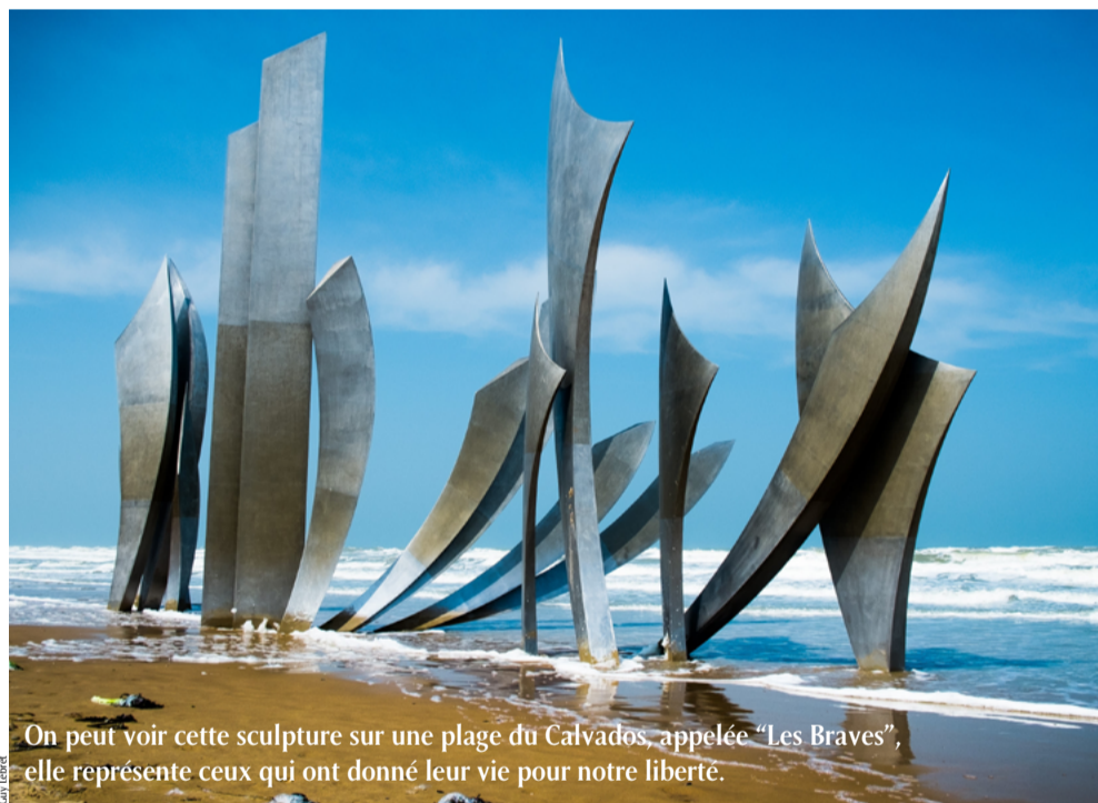
On peut voir cette sculpture sur une plage du Calvados, appelée "Les Braves", elle représente ceux qui ont donné leur vie pour notre liberté.

La liberté pour se réaliser a besoin de transcendance. Elle doit se laisser guider par l'infini.