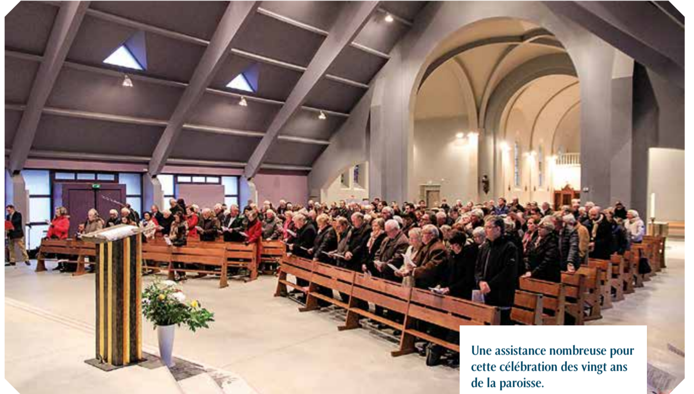
Une assistance nombreuse pour cette célébration des vingt ans de la paroisse.