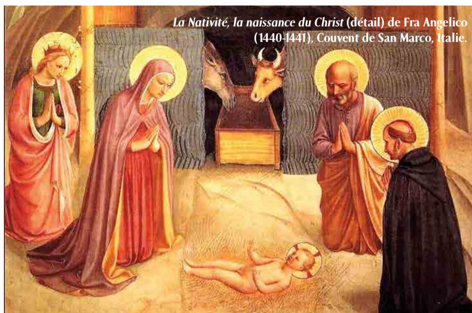
La Nativité, la naissance du Christ (détail) de Fra Angelico (1440-1441), Couvent de San Marco, Italie.