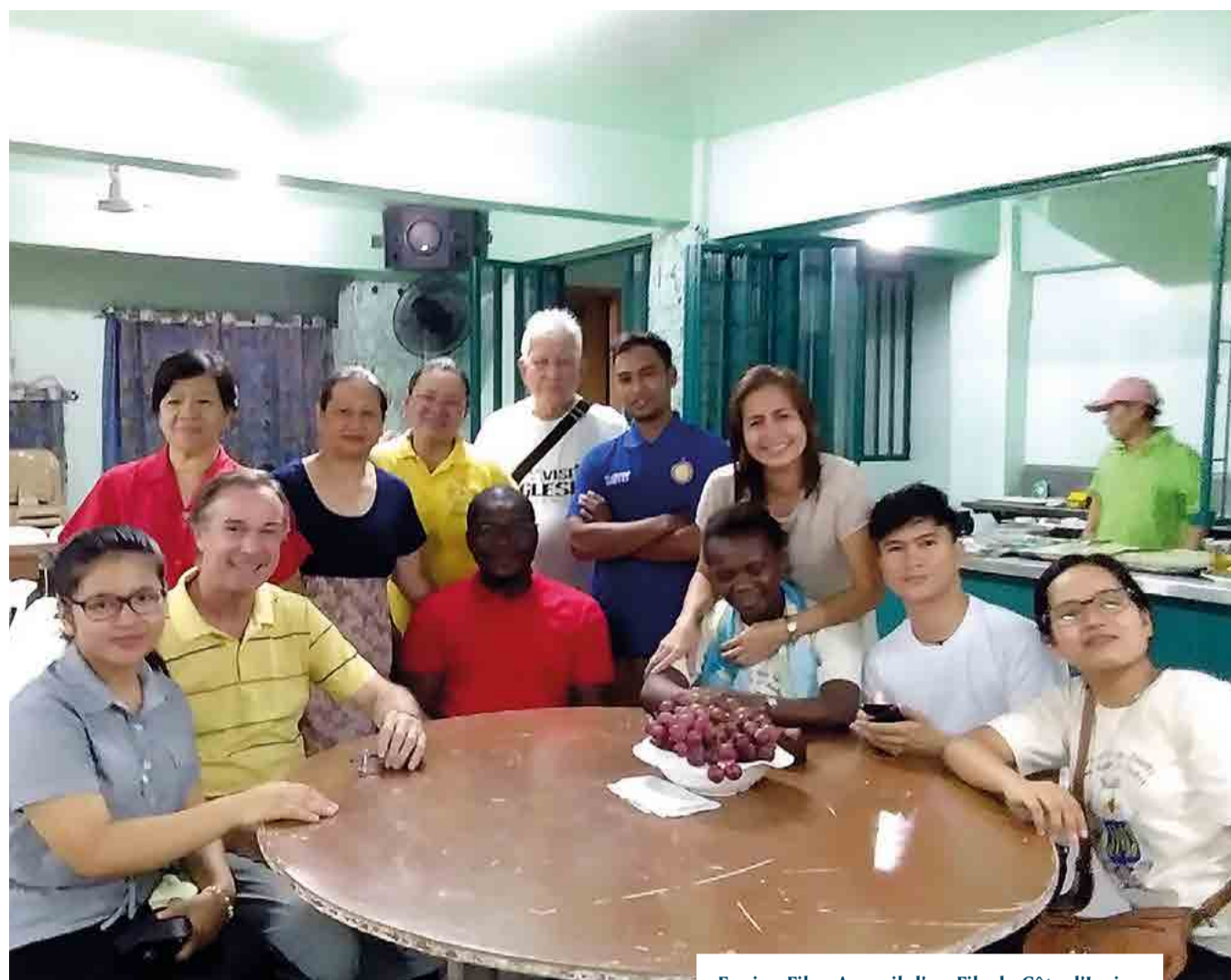
Equipe Fils - Accueil d'un Fils de Côte d'Ivoire.