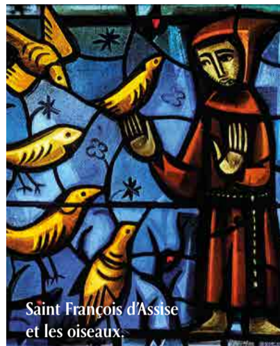
Saint François d'Assise et les oiseaux.

mot notre mère Terre (voir ci-contre). Même la Mort devient notre sœur. Elle n'angoisse plus, elle fond toutes les créatures dans le grand Tout de la Création du Très-Haut. Vous qui doutez, vous qui avez peur, lisez et relisez le Cantique des Créatures; il pacifie le cœur et l'esprit, il vous conduit vers Dieu. En 1209, le pape Innocent III (celui-là même qui créa l'Inquisition face à l'hérésie cathare) reconnaît l'ordre que crée François d'Assise, les "frères mineurs", les modestes franciscains, rejoints trois ans plus tard par les "pauvres dames", les clarisses, à l'initiative de Claire, amie de François. Après la mort de François, le peintre Giotto contribue à sa légende par des fresques dont celle du "sermon aux oiseaux" dans une basilique nouvellement construite.