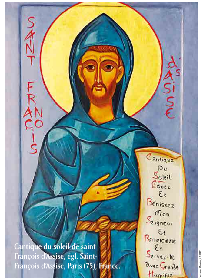
Cantique du soleil de saint François d'Assise, égl. Saint-François d'Assise, Paris (75), France.