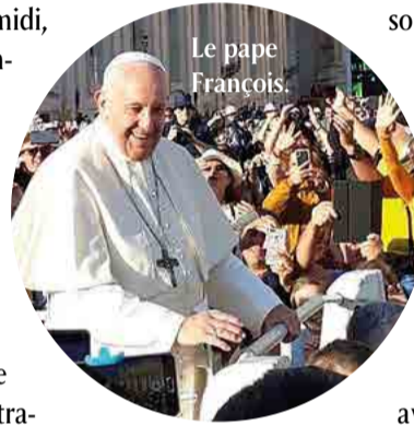
Le pape François.

accepté le titre en juin 2018. L'après-midi, nous avons visité le Colisée, qui est imposant et le Forum romain, témoins tous deux d'un passé prestigieux. Mercredi matin nous nous sommes levés tôt pour assister à l'Audience pontificale à Saint-Pierre avec le pèlerinage des adultes. Ce fut exceptionnel de voir des gens du monde entier, rassemblés pour prier, écouter le discours du pape et les nombreuses traductions dans toutes les langues. Avec plaisir, nous l'avons entendu nommer notre diocèse de Coutances et quelle joie de le voir porter puis embrasser des bébés! Ensuite nous sommes montés dans la coupole Saint-Pierre d'où nous avons eu une vue somptueuse sur tout Rome! Après cela nous nous sommes recueillis devant la tombe de saint Pierre. Revenus devant sa statue, nous avons touché son pied et nous avons prié. Enfin, comme tout au long de ce pèlerinage, nous avons pu admirer des œuvres inoubliables: la Pietà de Michel-Ange, la Colombe de l'Esprit saint et l'imposant bénitier. Jeudi nous avons visité les catacombes de San Callisto, terriblement impressionnantes! Nous nous