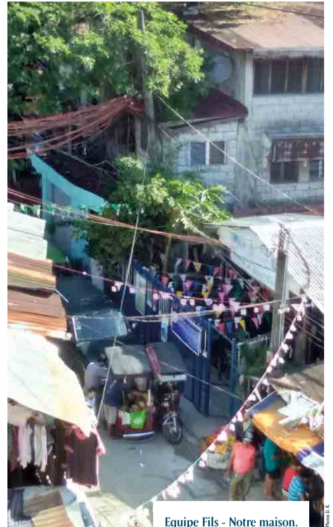
Equipe Fils - Notre maison.

De nombreux projets nous permettent de rejoindre les familles les plus pauvres: notre Centre de santé avec ses consultations médicales quotidiennes, consultations dentaires hebdomadaires, un service de kinésithérapie et une pharmacie de quartier vendant des médicaments génériques, rendent de nombreux services aux familles. Grâce à l'immersion quasi quotidienne d'étudiants en médecine d'un grand hôpital de Quezon City, nous pouvons développer une éducation à la santé auprès des enfants de l'école ou auprès des