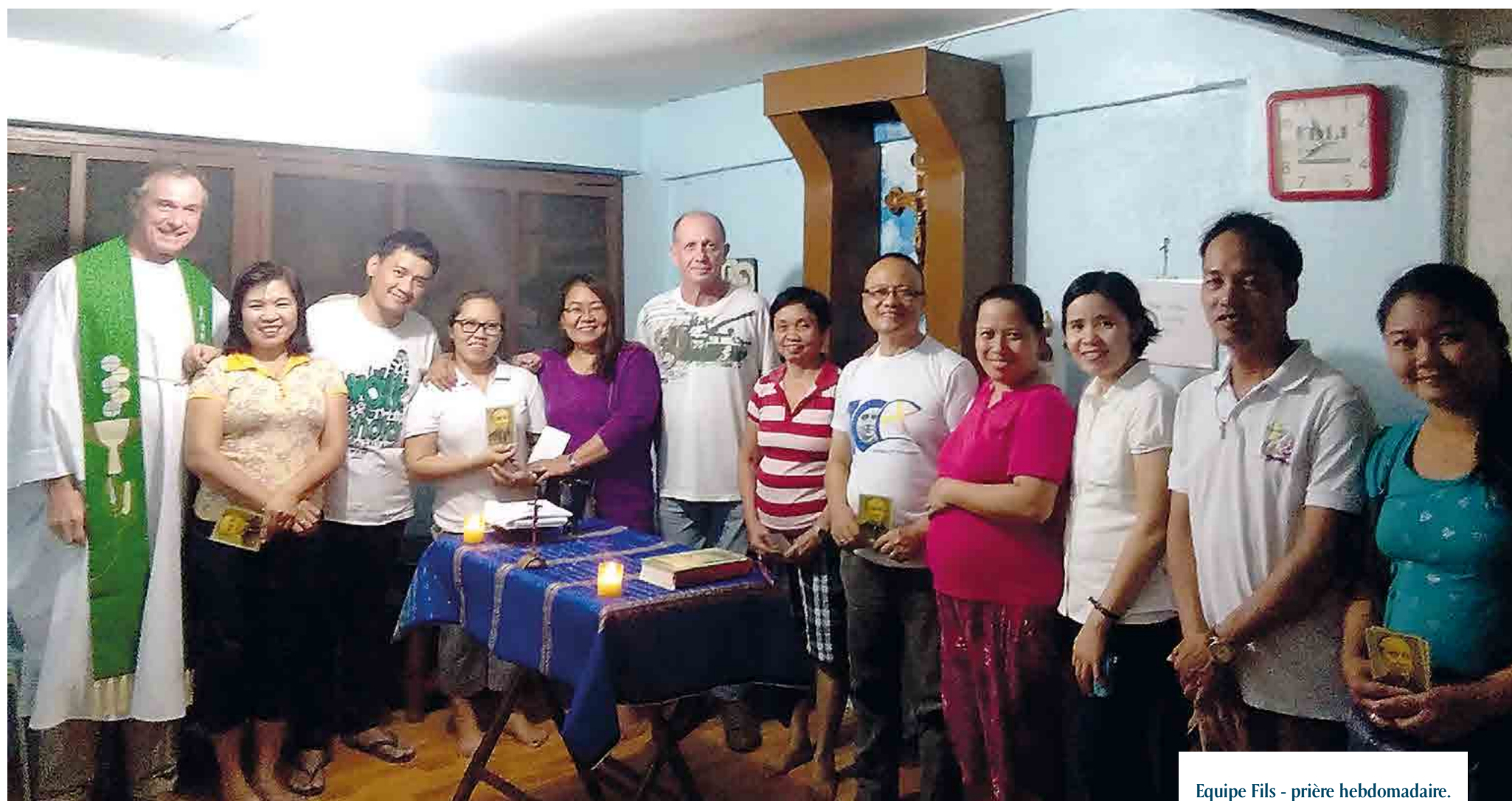
Equipe Fils - prière hebdomadaire.

DANIEL GODEFROY, QUEZON CITY, LE 4 OCTOBRE 2019