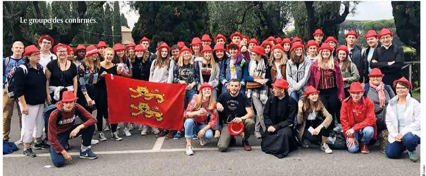
Le groupe des confirmés.

N ous avons visité la basilique Saint-Jean-de-Latran où nous avons pu découvrir quelques reliques de la passion du Christ: un morceau de la Croix de Jésus, un clou et deux épines de la couronne. Nous avons poursuivi notre journée par la visite du baptistère, grandiose, montrant l'importance du baptême pour les premiers chrétiens. De plus, il est important de préciser que la plupart des présidents français ont obtenu ou obtiennent le titre de chanoine de la basilique. Notre président actuel a