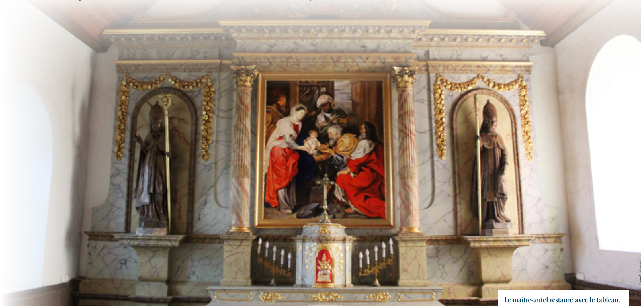
Le maître-autel restauré avec le tableau.