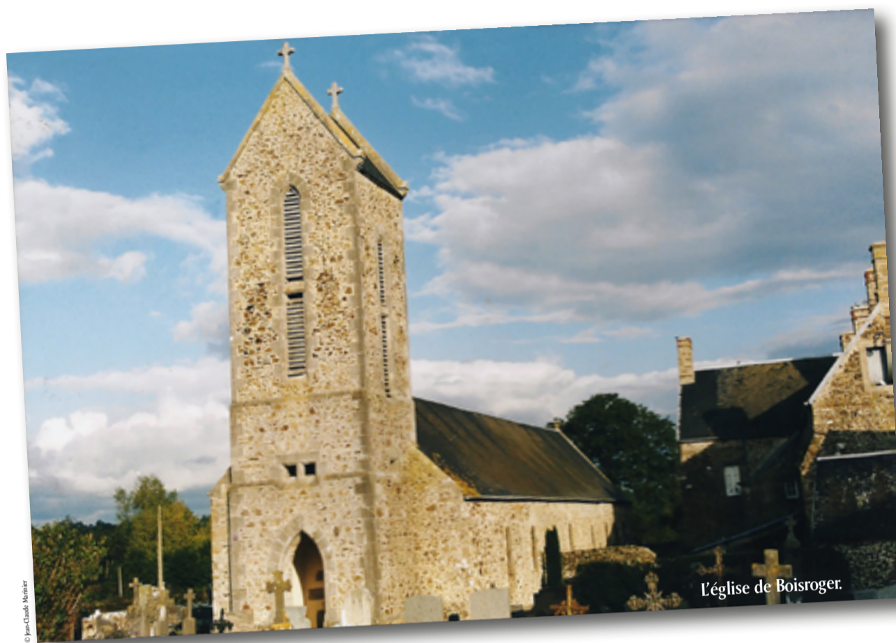
L'église de Boisroger.

L'association a été créée en septembre 1976 à l'initiative d'un habitant appartenant à l'une des plus vieilles familles de Linverville puisqu'on en trouve la trace pendant la Guerre de Cent ans. Dans les années 1960,