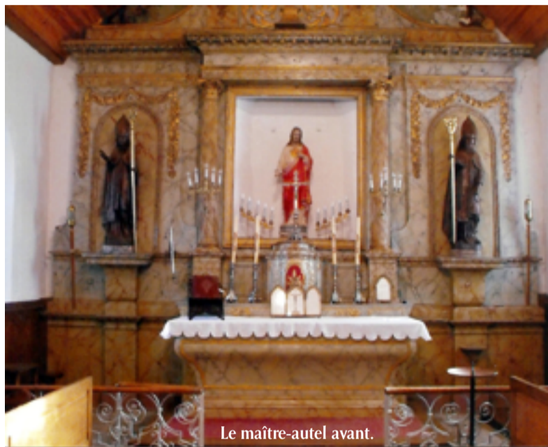
Le maître-autel avant.