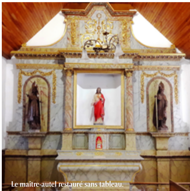
Le maître-autel restauré sans tableau.