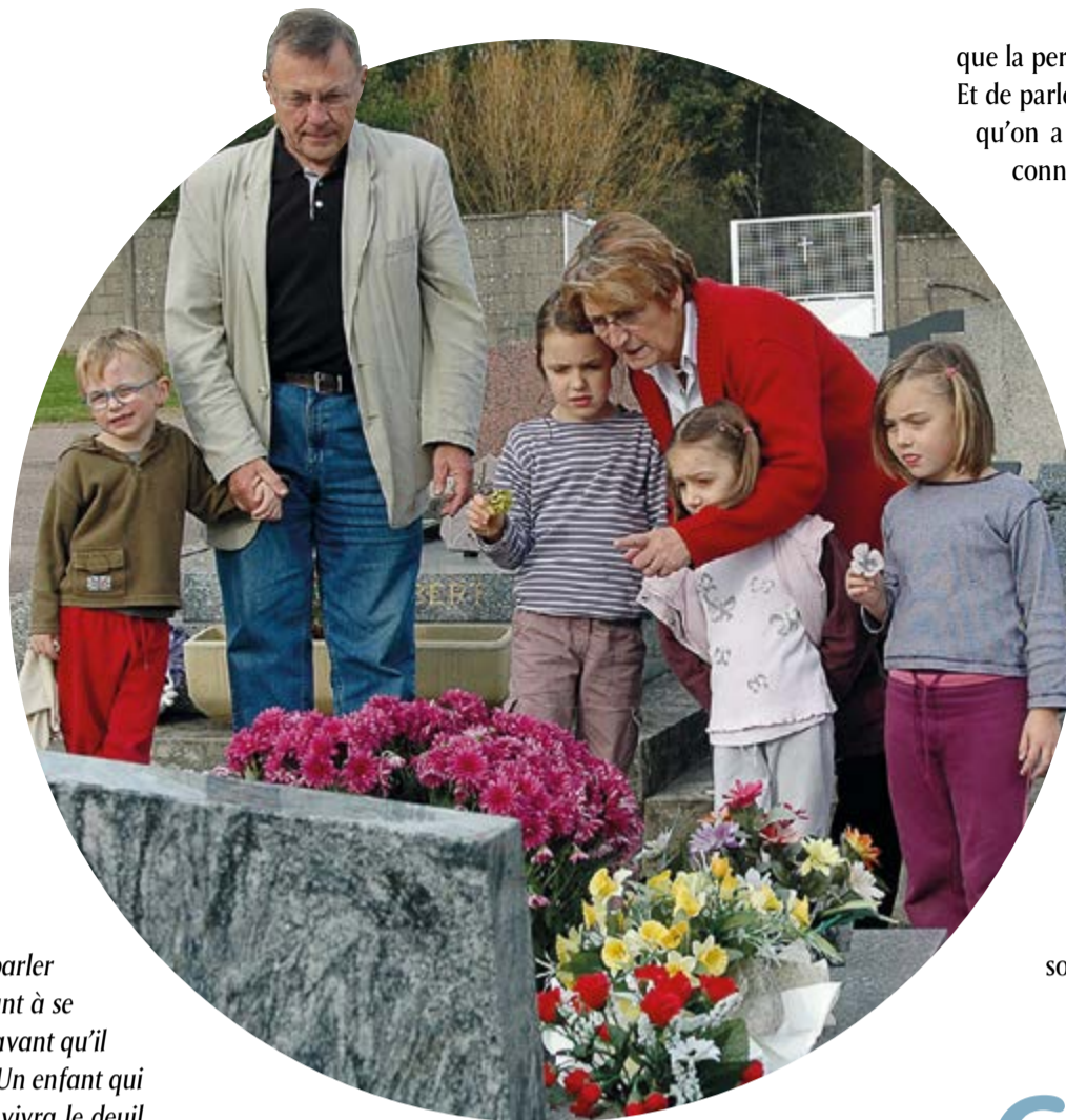
Lors de la Toussaint, des grands-parents et leurs petits enfants se recueillent sur une sépulture.

“Pouvoir transmettre l’espérance chrétienne, l’idée d’une vie qui ne finit pas, une vie d’amour auprès de Dieu, est assez rassurant pour l’enfant.”