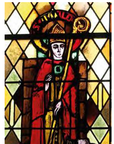
Gouville, Saint Malo.

Les chartes parlent d'une église en 1153 placée sous le vocable de saint Malo (15 novembre). Malo est évêque d'Aléth qui devient la ville de Saint-Malo en Ille et Vilaine. Il est invoqué pour guérir les furoncles et saint