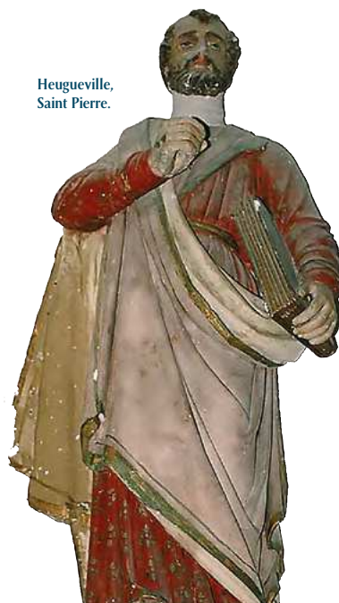
Heugueville, Saint Pierre.