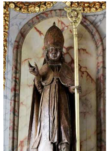
Boisroger, Saint Nicolas.

Cette église est placée sous le vocable de saint Nicolas (6 décembre) évêque de Myre en Lycie, on le prie pour la guérison de maladies nerveuses. Mais, c'est saint Sébastien (20 janvier) qui est fêté et aussi invoqué contre les maladies infectieuses et les épidémies.