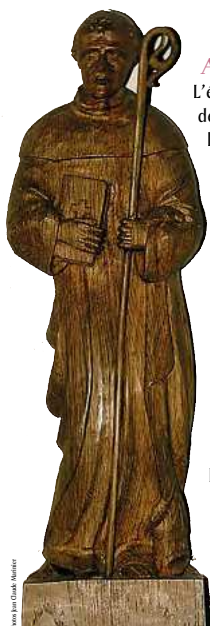
Agon, Saint Evroult (baptistère).

Ces églises pour la quasi-totalité datent du XI e ou XII e siècle avec des clochers en bâtières à l'exception de celle de Blainville-sur-Mer qui a un clocher flèche. Elles appartiennent aux communes qui les entretiennent. Ce n'est pas le cas de celle de Coutainville qui est, à l'origine, une petite chapelle privée construite à l'initiative d'une association en 1911, c'est-à-dire après la loi de séparation des églises et de l'État de 1905. Elle appartient maintenant à l'association diocésaine comme le centre paroissial d'Agon. Comme nous allons le voir plus loin, de nombreux saints de nos églises sont invoqués pour des pouvoirs de guérison.