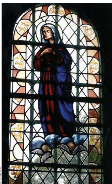
Montcarville, Notre Dame de l'Assomption.

Église sous le vocable de Notre-Dame-de-l'Assomption (15 août). Chaque année, saint Jean-Baptiste est fêté (24 juin). Il est invoqué pour les céphalées, les migraineuses, les maladies nerveuses voire l'épilepsie.