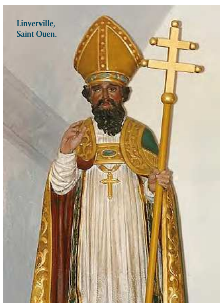
Linverville, Saint Ouen.

Église sous le vocable de saint Ouen (26 août), il est guérisseur des yeux. Saint Blaise évêque de Sébaste en Cappadoce (3 février) exerce la médecine, guérisseur des maladies affectant la gorge. Les statues de ces deux saints entourent le maître autel.