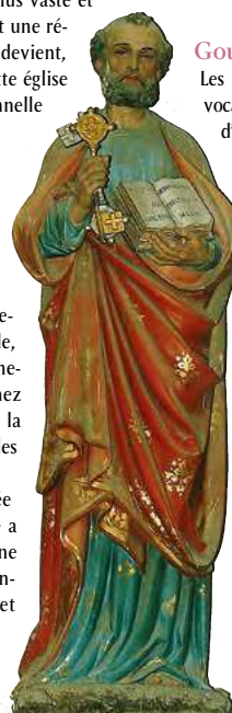
Blainville, Saint Pierre.

Cette église en forme de croix latine, typique avec son clocher flèche, est placée sous le vocable de saint Pierre (29 juin). Sur cette commune, au manoir de Gonnevillie, une chapelle, édifiée au XI e siècle, est dédiée à la Vierge. La Vierge de Gonnevillie est d'une très grande vénération chez les marins. C'est en ce lieu que se tenait la messe avant le départ et après le retour des terre-neuvas. Une messe est célébrée chaque année dans la cour du manoir le 15 août. Elle a pour second patron saint Philbert, moine qui a vécu au VII e siècle. Il a fondé principalement les monastères de Jumièges et de Noirmoutier (23 août).