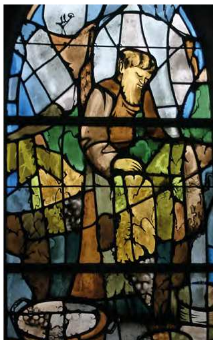
Saint-Malo-de-la-Lande, Saint Malo dans ses vignes.

L'église est sous le vocable de saint Malo (15 novembre). Dans cette commune, c'est saint Clair (18 juillet), qui est invoqué comme saint guérisseur des yeux. Il y a d'ailleurs, proche de l'église, la fontaine Saint-Clair.