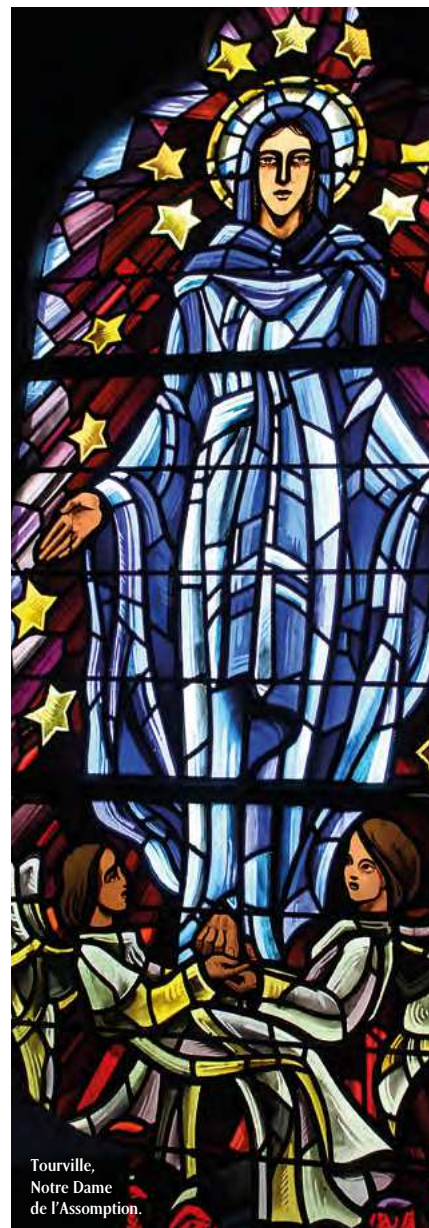
Tourville, Notre Dame de l'Assomption.