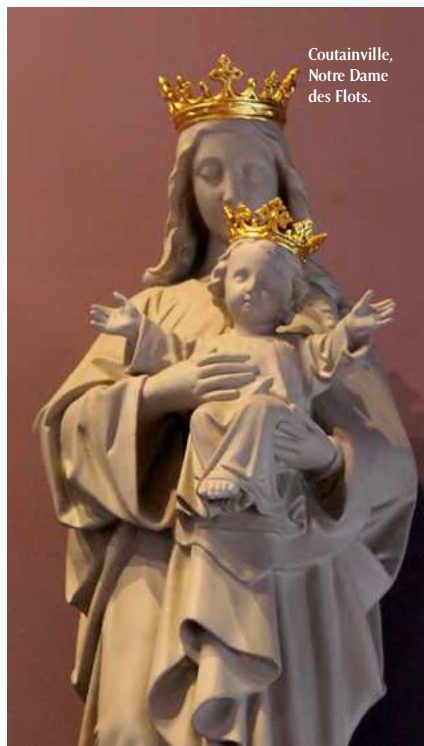
Coutainville, Notre Dame des Flots.

La chapelle, dès sa construction en 1911, a été placée sous le vocable de Notre-Dame-des-Flots. Dès 1930, elle s'avère trop petite. Agrandie