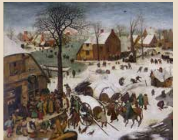
"Le Dénombrement de Bethléem" (détail) par Pieter Bruegel l'Ancien (Musée Oldmasters, musées royaux des Beaux-Arts de Belgique, Bruxelles)

Or, en ce temps-là, parut un décret de César Auguste pour faire recenser le monde entier. Ce premier recensement eut lieu à l'époque où Quirinius était gouverneur de Syrie. Tous allaient se faire recenser, chacun dans sa propre ville; Joseph aussi monta de la ville de Nazareth en Galilée à la ville de David qui s'appelle Bethléem en Judée, parce qu'il était de la famille et de la descendance de David, pour se faire recenser avec Marie son épouse, qui était enceinte... (Luc 2, 1-5)