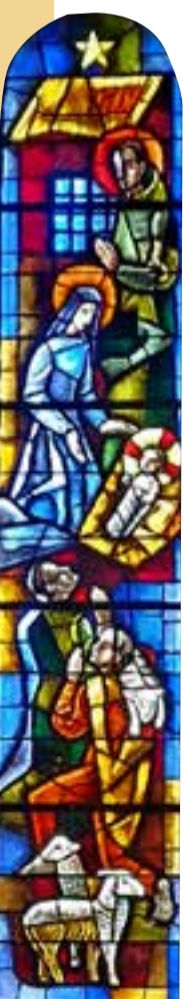
"Adoration des bergers" (église de Coutainville)

Les bergers s'en retournèrent, glorifiant et louant Dieu pour tout ce qu'ils avaient entendu et vu, et qui était conforme à ce qui leur avait été annoncé. (Luc 2, 8-20)