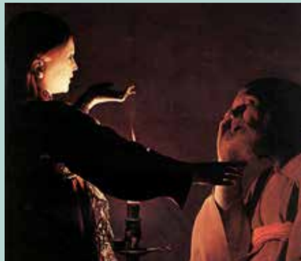
"Le songe de Joseph" par Georges de la Tour (Nantes, musée des Beaux-Arts)

"Joseph, fils de David, ne crains pas de prendre chez toi Marie, ta femme: car ce qui a été engendré en elle vient de l'Esprit saint; elle enfantera un fils, et tu l'appelleras du nom de Jésus car c'est lui qui sauvera son peuple de ses péchés." (Matthieu 1, 20-21)