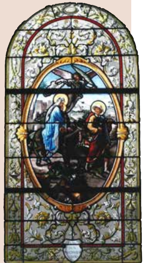
"La fuite en Égypte" (église de Linverville)

PAGES RÉALISÉES PAR MONIQUE COCHÉPAIN AVEC L'AIDE PRÉCIEUSE DE LUC ET MATTHIEU, ÉVANGÉLISTES