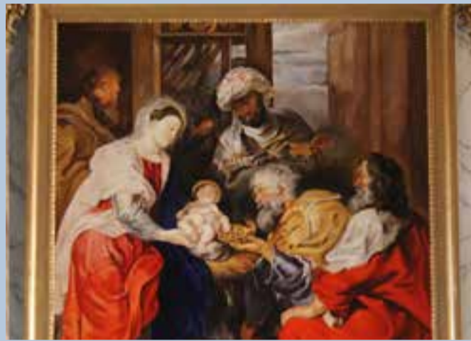
"L'adoration des mages" (église Saint-Nicolas de Boisroger)

Quand ils virent l'étoile, ils se réjouirent d'une très grande joie. Ils entrèrent dans la maison, ils virent l'enfant avec Marie sa mère; et, tombant à ses pieds, ils se prosternèrent devant lui. Ils ouvrirent leurs coffrets, et lui offrirent leurs présents: de l'or, de l'encens et de la myrrhe. Mais, avertis en songe de ne pas retourner chez Hérode, ils regagnèrent leur pays par un autre chemin. (Matthieu 2, 1-12)