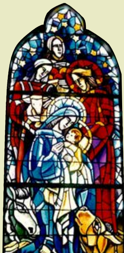
"La naissance de Jésus" (église de Tourville)

Pendant qu'ils étaient là, le temps où Marie devait accoucher arriva, et elle enfanta son fils premier-né. Elle l'emballota et le coucha dans une crèche, parce qu'il n'y avait pas de place pour eux dans l'hôtellerie. (Luc 2, 6-7)