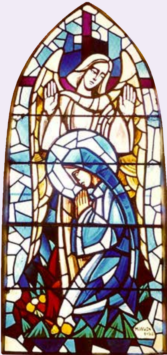
"L'Annonciation" (église de Saint-Malo-de-la-Lande)