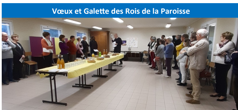
Vœux et Galette des Rois de la Paroisse

le jeudi 9 février, à 20 h 30 dans la salle paroissiale sous l'église d'Urville-Nacqueville